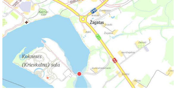
Objekta novietojuma shēma